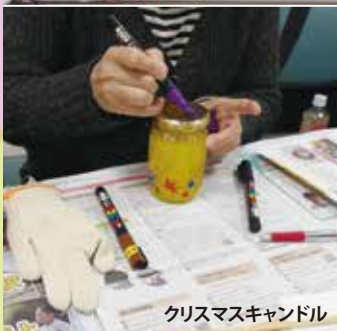
クリスマスキャンドル