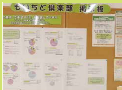
1階「もいちど倶楽部 掲示板」店内掲示板(レジ前)