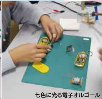
七色に光る電子オルゴール わくわく書育ランド書初め会