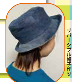
作品例：古布から夏のリバーシブル帽子作り