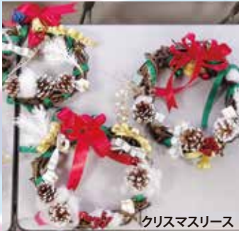
クリスマスリース