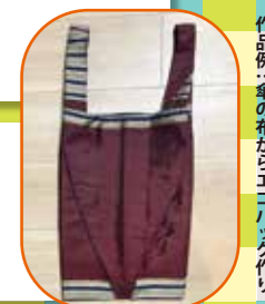
作品例：傘の布からエコバッグ作り